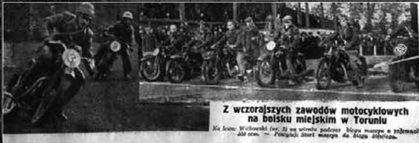
Z wczorajszych zawodów motocyklowych na boisku miejskim w Toruniu

Na lewo: Włocławek (nr. 3) na ustrzale podczas biegu marcy o pojemności 200 cm 3 . Poziwaj: Start marcy do 400 cm 3 pojemności.