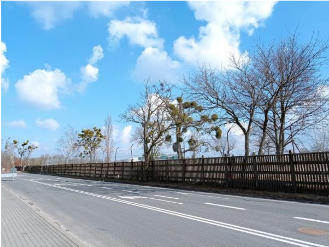
Dojazd do nieruchomości – ul. P. Jonssona