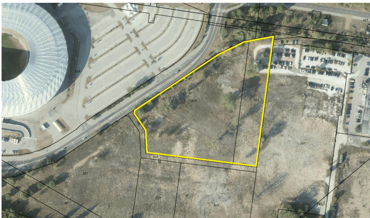
Zdjęcie nr 2. Plan miasta.